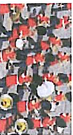
44 Musiker treten am Sonntag unter der Bärenfellmütze auf.

(webe) Die Regimental Band of the Welsh Guards besteht heute aus 44 Vollblutmusikern unter der traditionellen Bärenfellmütze. Am Sonntag, 12. September, tritt sie zwischen 11 und 12.30 Uhr auf der Landmesse in Krefeld auf. Ihren ersten Auftritt hatte die Band am 1. März 1916, beim St. Davids Day, zum Wechsel des Königs – „King's Guard Mounting“. Die Band of the Welsh Guards ist in London stationiert und nimmt regelmäßig an allen offiziellen zermonten Veranstaltungen in Großbritannien teil. So spielt sie unter anderem beim Wechsel vor dem Buckingham Palace sowie bei der jährlichen Trooping the Colour Parade anlässlich des Geburtstages von Königin Elisabeth II.