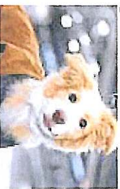
Beim der Hunde-Modenschau werden die neuesten Trends gezeigt.

(webe) Spiegeln, Spiegeln an der Wand – wer ist der schönste Hund im ganzen Land? Im Rahmen der British Days + Country Fair können Hundehalter ihre vierbeinigen Freunde auf dem Messtand von „Wolters Cat & Dog“ (Standnummer E17) zum Casting-Wettbewerb anmelden. Mitmachen lohnt sich: Der Siegerhund aller in Deutschland vorgenommenen Castings ziert das Cover des neuen Wolters-Katalogs 2011. Zu gewinnen gibt es ein professionelles Fotoshooting sowie einen Wert von 500 Euro. Und was trägt der Hund? Antworten liefert eine Hundemodenschau. Gezeigt werden die aktuellen Kollektionen für alle Jahreszeiten.