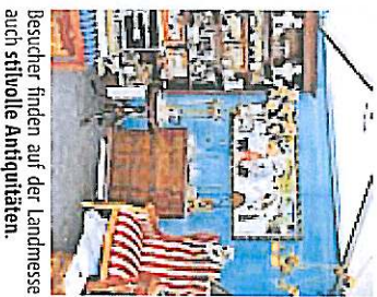
Besucher finden auf der Landmesse auch stihvolle Antiquitäten .

Männer, die mit Baumstämmen und Steinen um sich werben, kennt man eigentlich aus Schottland. Dort versammeln sich jedes Jahr die stärksten Kerle der Insel, um sich zu messen. Highland Games nennen sich die sportlichen Wettkämpfe, bei denen Muskel und Geschicklichkeit zählen. Die bekanntesten Spielarten dieser Art finden Anfang September in Bremen, Aberdeenshire, statt. Schirmherrin ist Königin Elisabeth II., deren Sommerstutz das nahe gelegene Balmoral Castle ist. Auch die Besucher der British Days + Country Fair können den Kadroproze bei der Arbeit zusehen. In schottischer Nationaltracht – Kilt und kitchhe Strümpfe – treten die Männer am Wochenende, 11. und 12. September, in fünf Disziplinen auf der Burg Linn