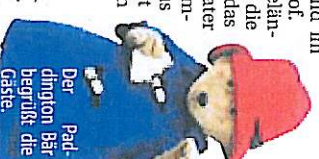
Der Peddington Bär begrüßt die Gäste.

finden Besucher bei Le Hanne oder Sigrid Axtheim. Kulturleier Höhepunkt ist das „Open Air Proms Concert“ am Samstagabend im Burghallenhof. Auf dem Gelände rund um die Burg zeigt das Street Theater „The Lemmings“ aus dem Covent Garden in London Slapstick-Comedy vom Feinsten. Auf der Bühne spielen die Gruppen „The Mark Bennett Band“ und „Austri“ Irish Folk.